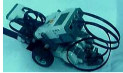
Gambar 1 Robot lego untuk maze solver

Untuk menyelesaikan permasalahan berupa line maze, Robot LEGO MINDSTORM NXT dirangkai menjadi sebuah robot line follower, yang terdiri dari beberapa komponen utama berupa; (a) Brick Lego sebagai komponen utama robot, (b) dua buah servo motor sebagai penggerak robot, (c) dua buah light sensor yang digunakan untuk membaca jalur maze , (d) sensor ultrasonik yang digunakan untuk mendeteksi bagian akhir atau titik tujuan dari maze berupa objek yang menghalangi pergerakan robot pada jalur maze . Bentuk robot lego yang dirangkai bisa dilihat pada gambar 1.