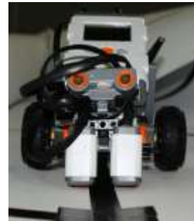
Gambar 2 Robot dengan sensor cahaya dan ultrasonik

Dua buah light sensor yang dirangkai sejajar – seperti yang digambarkan pada gambar 2 – digunakan untuk membaca jalur line maze dengan teknik menempatkan jalur hitam diantara kedua buah sensor tersebut. Hal dilakukan untuk mempercepat pembacaan jalur maze . Untuk mendefinisikan sebuah perpotongan atau belokan jalur maze, maka diidentifikasi dengan membuat kotak dengan ukuran melebihi ukuran jarak sensor. Gambaran persimpangan jalur maze bisa dilihat pada gambar 2 dan gambaran ujung maze bisa dilihat pada gambar 3.