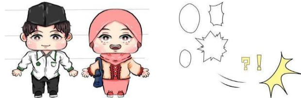
Figure 3. Elemen visual

Gambar 3 menunjukkan elemen visual motion comic , seperti efek fade in/out , transisi panel, dan teknik cut-out animation. Balon obrolan berbentuk gelembung dengan font Comic Sans MS. Animasi 2D menampilkan latar kantor Kemenag Batam, karakter pegawai dan jemaah dewasa, serta efek sesuai ekspresi. Dua tokoh utama bergaya semi- chibi adalah Ibu Yasmin (jemaah ramah namun bingung) dan Pak Jojo (pegawai informatif). Pewarnaan dominan pastel, line art memakai pressure, dan suara disesuaikan dengan konsep informasi haji.