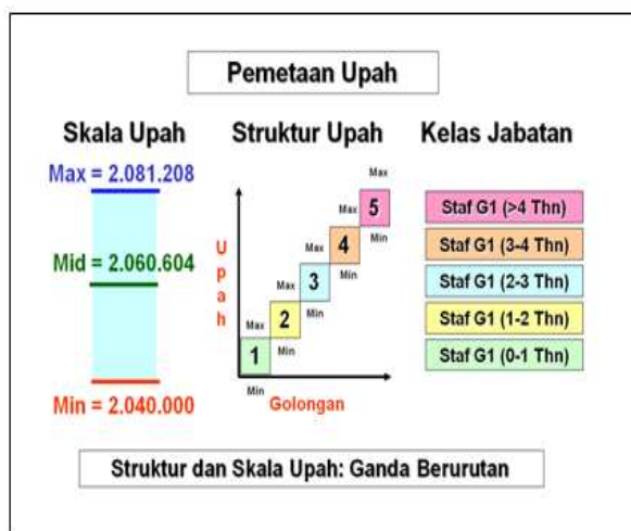
Gambar 2 Hasil Pemetaan Upah Metode Skala Ganda Berurutan Sederhana

Pemetaan upah yang diperoleh kemudian dijadikan acuan untuk menentukan gaji atau upah setiap karyawan. Untuk membedakan gaji atau upah yang diberikan kepada karyawan dalam satu grade yang sama, Manager HR/GA menganalisisnya berdasarkan periode lamanya karyawan tersebut bekerja pada perusahaan. Semakin loyal atau setia karyawan tersebut, maka rate gaji yang diberikan akan semakin tinggi. Hal ini tetap mengacu kepada nilai nominal pemetaan upah yang sudah dirancang atau dibuat.