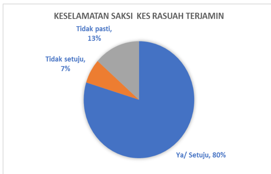
Grafik 5 Pecahan Peratusan Item yang Mendapat Skor Peratusan Tertinggi

. Penekanan yang lebih kepada aspek kemanusiaan seperti yang diterapkan di dalam kursus kursus wajib universiti berkod 'MPU-Mata Pelajaran Umum' dapat memberi kesan yang baik kepada graduan universiti. Sikap empati yang tinggi jika dapat diterapkan di kalangan graduan amat berguna kepada mereka (Ahmad, Muhammad & Jamil, 2019) kerana mereka akan menjadi lebih sedar dan cakna akan aspek hak, tanggungjawab dan integriti yang mesti didokongi dengan mantap.