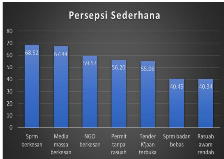
Grafik 3 Tujuh Item dengan Persepsi Sederhana Mengenai Rasuah

Terdapat empat item yang menunjukkan persepsi yang sangat membimbangkan mengenai rasuah di mana hanya 25.89 % bersetuju bahawa tahap pengambilan rasuah di negara ini adalah rendah. Secara tidak langsung, ini bermakna bahawa 66.29% bersetuju bahawa kadar pengambilan rasuah di negara ini adalah tinggi. 26.92% bersetuju bahawa rasuah dalam sektor politik adalah terkawal. Jika digabungkan peratusan responden yang tidak setuju dan tidak pasti dengan item tersebut, ini bermakna 73.08% berpegang dengan persepsi bahawa rasuah dalam sektor politik adalah tidak terkawal. Responden juga memberikan persepsi bahawa tahap pengambilan rasuah di negara ini adalah tinggi, di mana hanya 25.89 % bersetuju bahawa pengambilan rasuah adalah rendah dan hanya 35.94% sahaja percaya bahawa usaha pencegahan rasuah oleh pemerintah semakin berjaya. Maklumat lengkap boleh dilihat di dalam grafik 4 berikut.