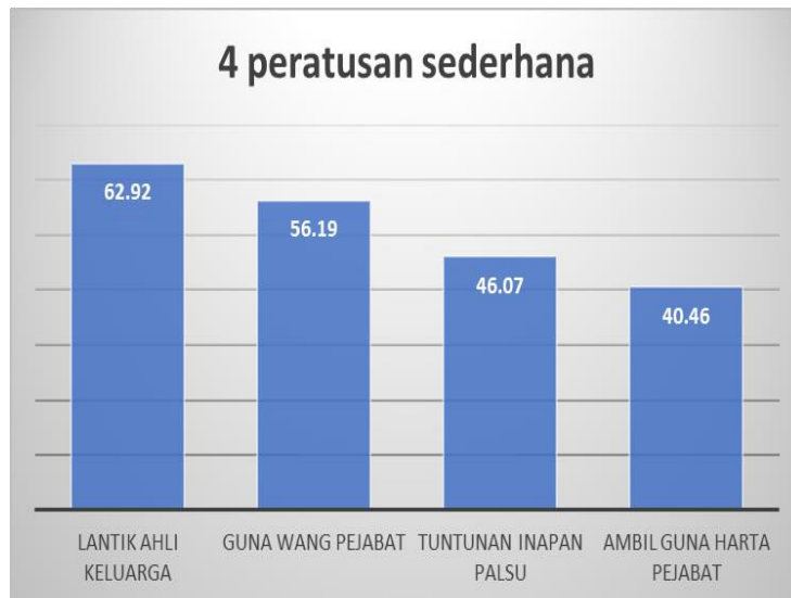
Grafik 2 Empat Perlakuan Rasuah dengan Peratusan Sederhana

Berdasarkan latar belakang responden yang telah mengikuti pembelajaran kursus Integriti dan Antirasuah selama hampir satu semester, sepatutnya mereka mampu memahami dan dapat membezakan di antara perlakuan rasuah atau sebaliknya. Dapatan daripada hasil kajian menggambarkan seolah-olah masih wujud kekeliruan dan keraguan di kalangan sebahagian responden untuk memahami sama ada sesuatu perlakuan tersebut adalah rasuah ataupun tidak.