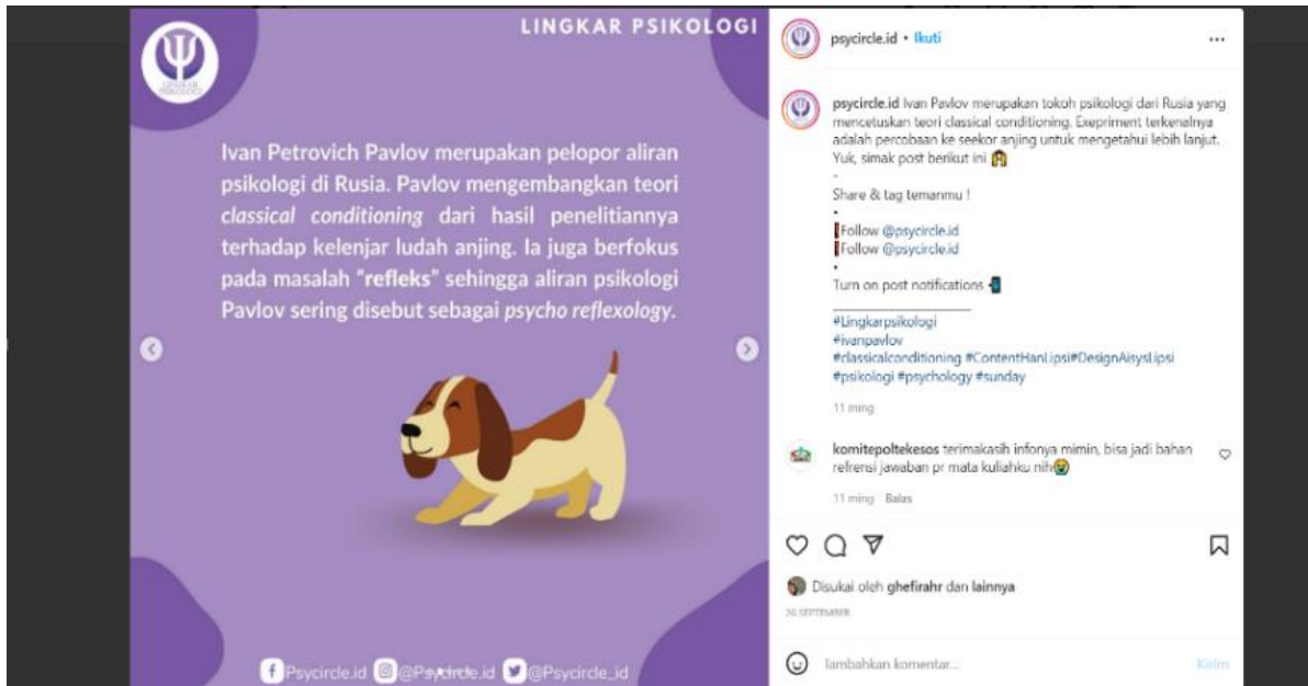
Gambar 1 Instagram