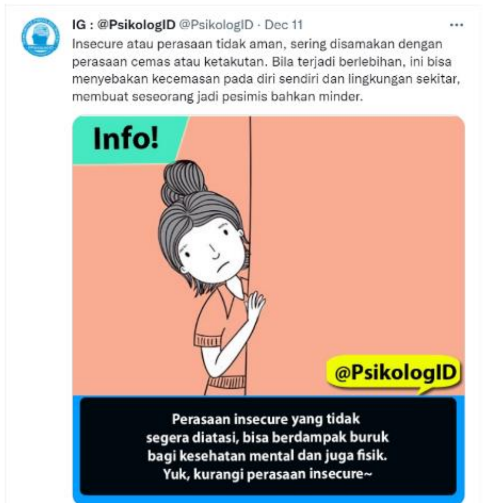
Gambar 2 Twitter