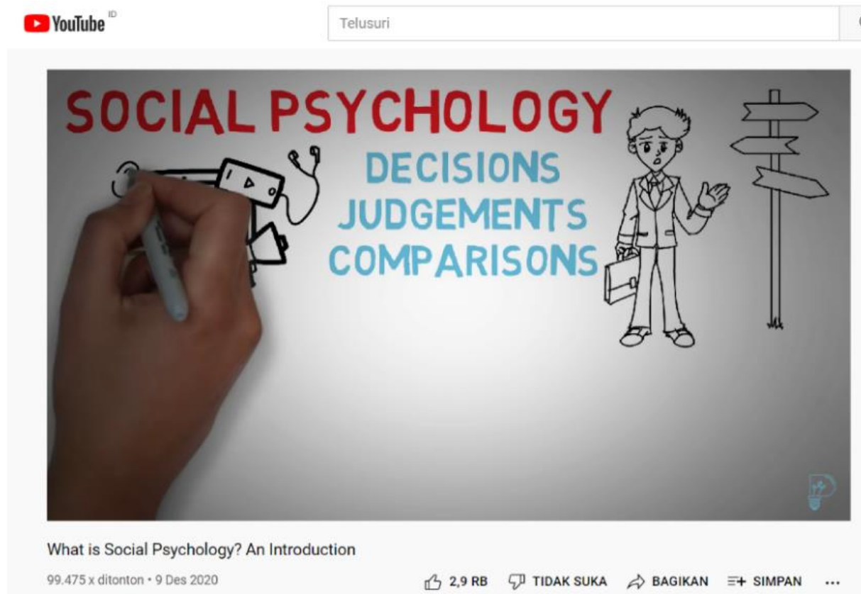
Gambar 3 YouTube

dengan video daripada dengan mengkomunikasikan pengetahuan yang biasanya hanya melalui buku. Dengan adanya YouTube, mahasiswa akan lebih tertarik untuk memahami ilmu dan informasi dengan lebih baik. Media pembelajaran melalui YouTube dapat didesain semenarik mungkin agar mahasiswa tidak cepat bosan sehingga mahasiswa dapat memahami informasi atau pelajaran dari YouTube.