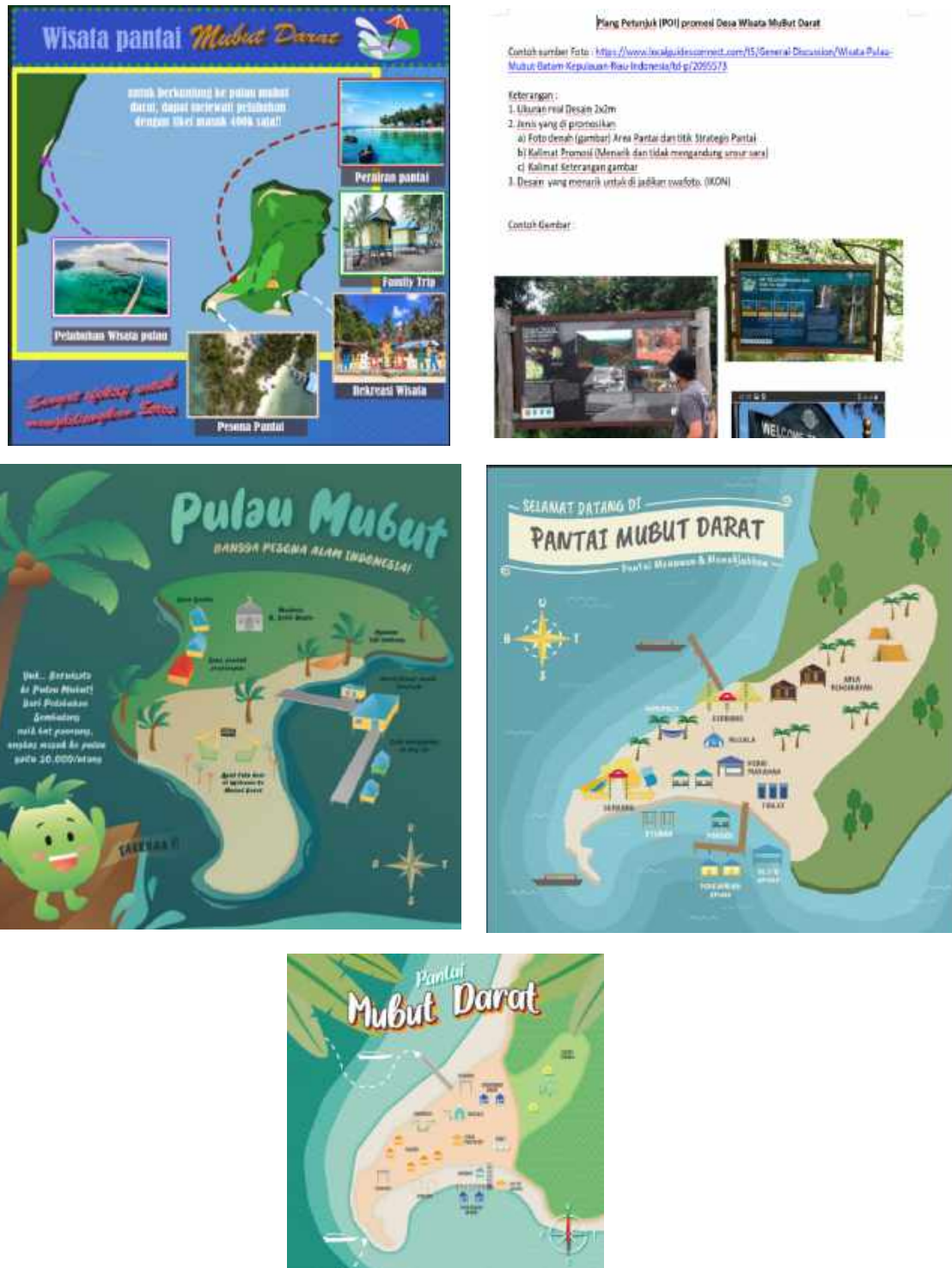
Gambar 4. Desain Grafis POI Desa Wisata Mubut Darat

Tahap selanjutnya adalah memberikan tugas Desain Grafis pada proyek PBLAN-01 untuk membuat desain yang menarik dalam bentuk UAS yang harus dikerjakan mahasiswa. Hasil yang diperoleh dapat disimak pada gambar berikut.