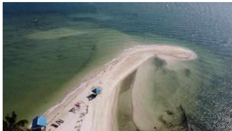
Gambar 3. Foto POI Desa Wisata Mubut Darat