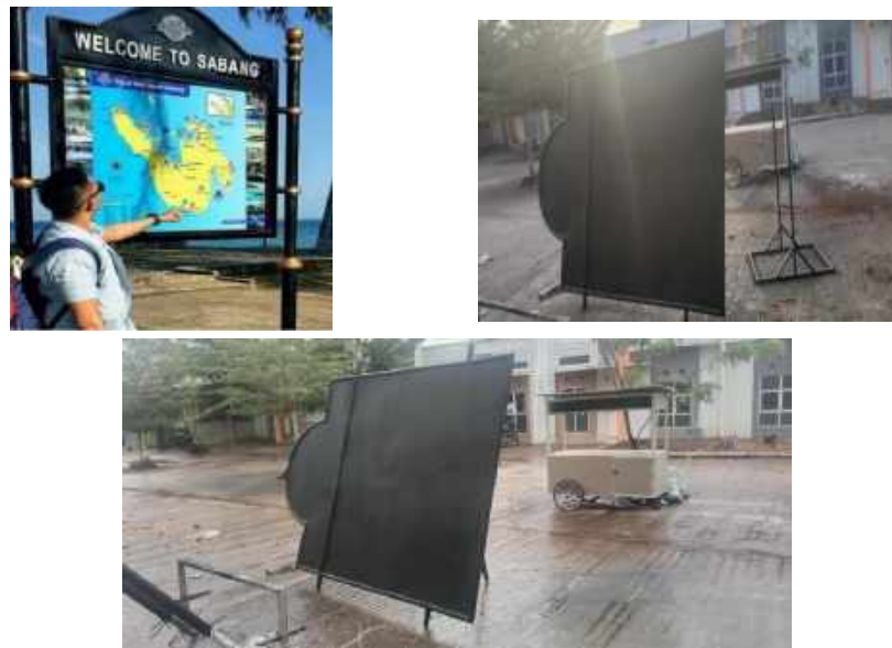
Gambar 1. Perancangan Plang POI Desa Wisata Mubut Darat

Alur Pengabdian Masyarakat di Pulau Mubut Darat dapat dilihat pada model flow chart di bawah ini.