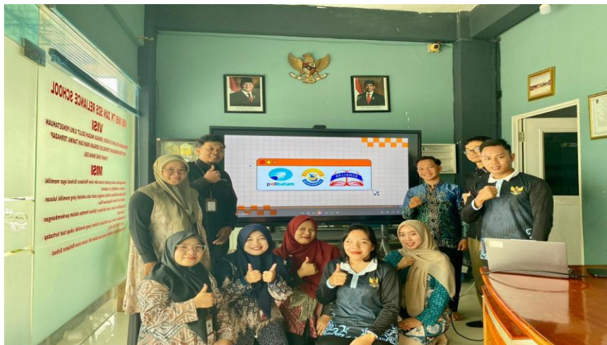
Gambar 1. Kegiatan Penyerahan Video Pembelajaran dengan Sekolah Reliance School Batam

Kegiatan pengabdian diawali dengan penyerahan secara langsung video pembelajaran kepada pihak sekolah Reliance School Batam dan guru-guru mata pelajaran terkait, pada tanggal 15 Januari 2026. Dengan adanya video pembelajaran interaktif, kegiatan pengabdian ini diharapkan dapat menambah variasi penyampaian materi pembelajaran di kelas.