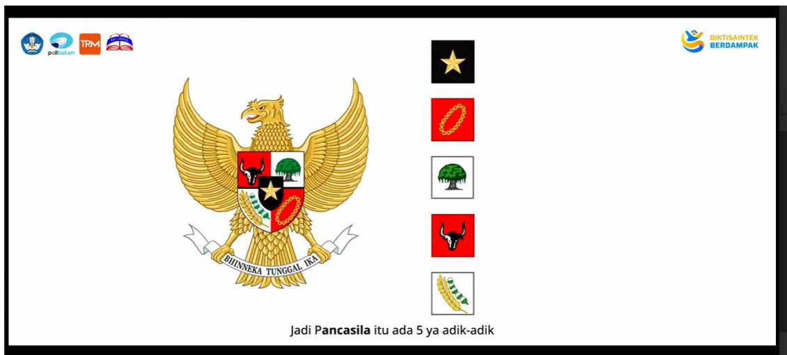
Gambar 2. Cuplikan Video Pembelajaran Penanaman Nilai-Nilai Pancasila

Gambar di atas merupakan cuplikan video pembelajaran yang berisi materi nilai-nilai Pancasila, disertai dengan gambar nyata simbol Pancasila. Melalui video interaktif, siswa menjadi lebih mengenal secara mendalam arti dan bentuk penanaman nilai-nilai tersebut dalam kehidupan sehari-hari.