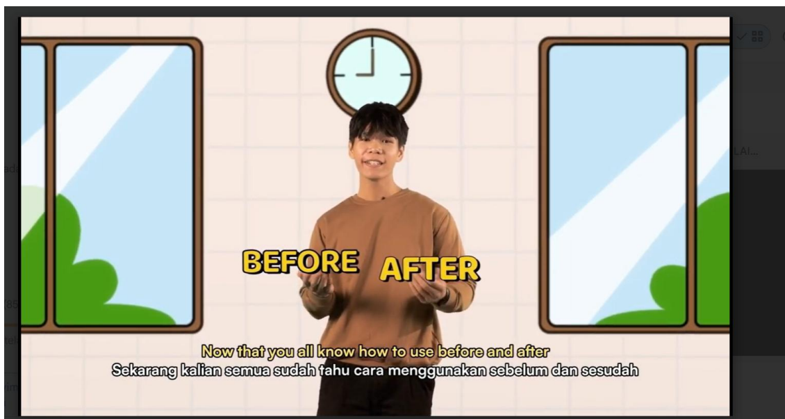
Gambar 3. Cuplikan Video Pembelajaran Bahasa Inggris

Gambar di atas merupakan cuplikan video pembelajaran yang berisi materi nilai-nilai Pancasila, disertai dengan gambar nyata simbol Pancasila. Melalui video interaktif, siswa menjadi lebih mengenal secara mendalam arti dan bentuk penanaman nilai-nilai tersebut dalam kehidupan sehari-hari.