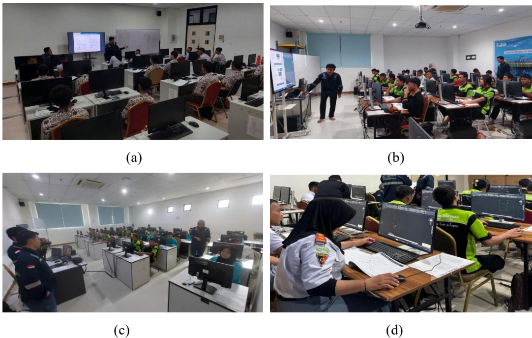
Gambar 1. Dokumentasi kegiatan pelatihan: (a) hari pertama, (b) hari kedua, (c) hari ketiga, (d) hari keempat

peserta diperkenalkan dengan konsep dasar konstruksi kapal dan peran drafter dalam proses desain serta produksi kapal. Setelah itu, peserta diberikan materi pengenalan perangkat lunak Computer Aided Design (CAD) , penggunaan perintah dasar, pembuatan objek gambar, pengaturan tampilan gambar, pemberian dimensi, hingga pengenalan gambar tiga dimensi. Pendekatan bertahap ini bertujuan agar peserta yang belum memiliki pengalaman sebagai drafter kapal dapat memahami materi dari tingkat dasar sebelum masuk ke praktik yang lebih kompleks (tingkat lanjut).