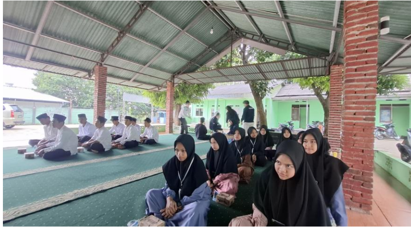
Gambar 3. Santri peserta PKM

Tahap selanjutnya berfokus pada penguatan keterampilan teknis santri melalui praktik langsung pembuatan konten dakwah digital. Pada tahap ini, santri dilatih membuat video pendek, poster dakwah, dan tulisan singkat yang efektif dan komunikatif. Pelatihan mencakup proses brainstorming ide, teknik pengambilan gambar, penggunaan aplikasi editing sederhana, hingga penyusunan caption dan teknik publikasi konten yang sesuai karakteristik masing-masing platform. Santri juga memperoleh pendampingan intensif dalam pengelolaan akun media sosial, mulai dari penjadwalan unggahan, membangun interaksi sehat dengan audiens, hingga memahami dasar-dasar analitik untuk mengukur jangkauan dan efektivitas konten. Pendampingan dilakukan secara bertahap untuk memastikan santri tidak hanya mampu memproduksi konten, tetapi juga memiliki kemampuan mengelola akun dan menjaga keberlanjutan aktivitas dakwah digital pesantren.