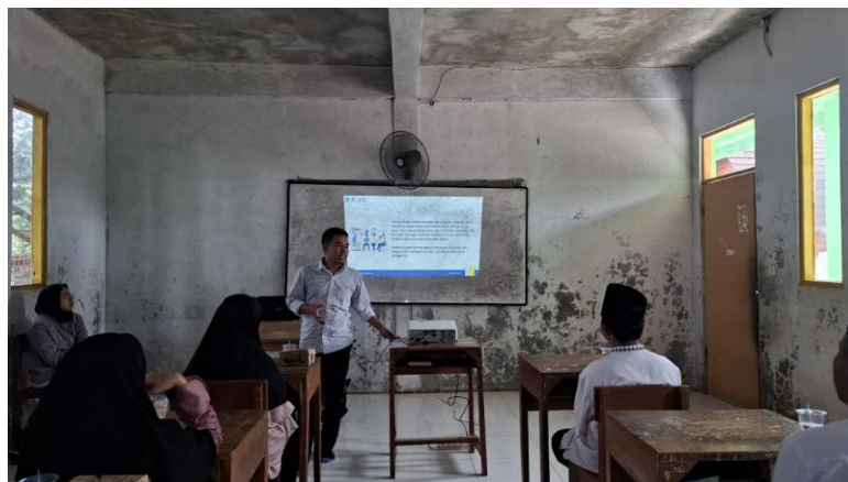
Gambar 4. penyuluhan mengenai etika Media Sosial pematari

Tahap selanjutnya berfokus pada penguatan keterampilan teknis santri melalui praktik langsung pembuatan konten dakwah digital. Pada tahap ini, santri dilatih membuat video pendek, poster dakwah, dan tulisan singkat yang efektif dan komunikatif. Pelatihan mencakup proses brainstorming ide, teknik pengambilan gambar, penggunaan aplikasi editing sederhana, hingga penyusunan caption dan teknik publikasi konten yang sesuai karakteristik masing-masing platform. Santri juga memperoleh pendampingan intensif dalam pengelolaan akun media sosial, mulai dari penjadwalan unggahan, membangun interaksi sehat dengan audiens, hingga memahami dasar-dasar analitik untuk mengukur jangkauan dan efektivitas konten. Pendampingan dilakukan secara bertahap untuk memastikan santri tidak hanya mampu memproduksi konten, tetapi juga memiliki kemampuan mengelola akun dan menjaga keberlanjutan aktivitas dakwah digital pesantren.