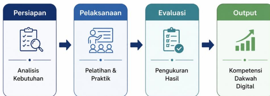
Gambar 2. Metode penelitian

Metode pelaksanaan kegiatan ini terdiri atas empat tahapan, yaitu persiapan, pelaksanaan, evaluasi, dan output. Pelaksanakan kegiatan yang tepat dapat menghasilkan program yang baik dan meningkatkan kualitas siswa (Putri, 2025). Tahap persiapan dilakukan melalui analisis kebutuhan mitra, dilanjutkan dengan pelatihan dan praktik dakwah digital pada tahap pelaksanaan. Selanjutnya, evaluasi dilakukan untuk mengukur hasil kegiatan. Output yang diharapkan adalah meningkatnya kompetensi santri dalam memanfaatkan media digital sebagai sarana dakwah. Gambar 1 menunjukkan alur tahapan kegiatan yang dilaksanakan.