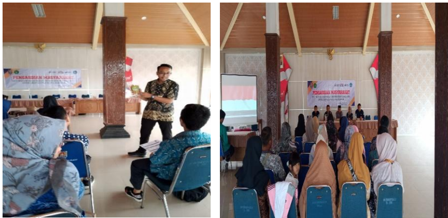
Gambar 3 Pelaksanaan Pelatihan

Materi yang di sampaikan antara lain Peraturan Perundang-undangan di Bidang Pangan, Cara Produksi Pangan yang Baik untuk Industri Rumah Tangga (CPPB-IRT), Prosedur Operasional Sanitasi yang Standar, Penggunaan Bahan Tambahan Pangan, Teknologi Proses Pengolahan Pangan dan Pembuatan Alur Produksi, Label dan Kemasan Pangan, serta Perhitungan Informasi Nilai Gizi. Sebelum pemateri menyampaikan materi ada soala pretest dan setelah pemateri selesai menyelesaikan materi ada soal posttest.