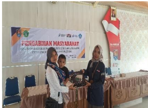
Gambar 4 Penyerahan barang alat dan teknologi

sangat kurang sebesar 0% atau bisa dikatakan tidak ada peserta yang menyatakan cukup, kurang atau sangat kurang. Dengan demikian dapat dikatakan bahwa berdasarkan angket tanggapan peserta pelatihan dari 30 peserta pelatihan menyatakan sarana dan prasarana pelatihan sangat baik.