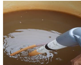
Gambar 2. Isi tandon pertama

Pada tangki pertama menggunakan sistem filter biocarb , yaitu sebuah Karbon aktif. Karbon aktif merupakan sebuah material yang memiliki pori-pori sangat banyak dan luas. Pori-pori ini berfungsi untuk menyerap setiap kontaminan melaluinya.