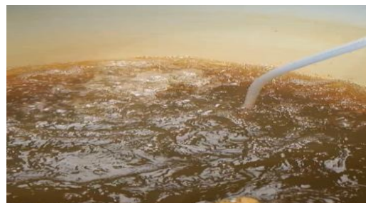
Gambar 3. Isi tandon kedua

Pada tandon ke-dua menggunakan biocarb sama seperti tangki pertama, tetapi pada drum ke-dua ini ditambah aerasi yaitu gelembung-gelembung udara yang berguna untuk menghilangkan senyawa kimia yang dapat mempengaruhi bau dan rasa pada air, seperti metana, hidrogen sulfida, atau senyawa lain yang bersifat volatile atau menguap di air. lalu pada bagian bawah pada tangki kedua ini dibuat dudukan biocarb agar terisi air yang telah terfilter dan dilanjutkan ke tahap filter selanjutnya. Pada tandon ke-tiga terdapat pompa sirkulasi untuk menransfer air dari tangki 3 ke tangki 1 untuk proses filtrasi ulang.