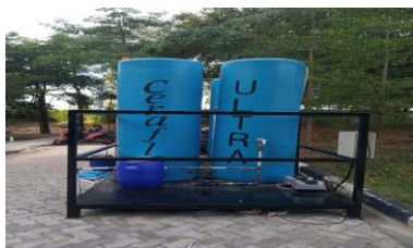
Gambar 1. Tangki Water Treatment

Pada bagan ini menjelaskan bahwa proses Water Treatment berawal dari sumur kotor yang disedot menggunakan pompa air dengan Daya 330 Watt.