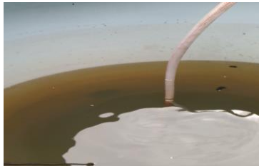
Gambar 4. Isi tandon ketiga

Pada tandon ke-empat terdapat membran dan ultra carb . Membran ini memiliki struktur pori-pori agar menyaring air yang kotor, ditengahnya ada sebuah saluran air untuk keluar sebagai filter akhir. Pada membran dibuat frame agar membran terletak ditengah dan sebagai pembatas dari komponen ultra carb dan bio carb .