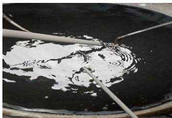
Gambar 5. Isi tandon keempat